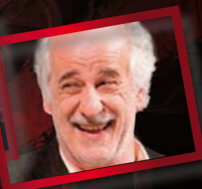
TONI SERVILLO LE VOCI DI DENTRO DAL 19 AL 23 FEBBRAIO