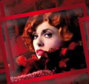
ROSSELLA BRESCIA AMARCORD 16 FEBBRAIO