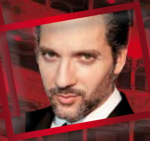
GIUSEPPE FIORELLO PENSO CHE UN SOGNO COSÌ... DAL 22 AL 26 GENNAIO