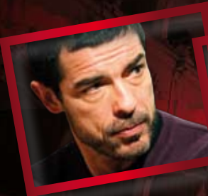
ALESSANDRO GASSMANN RIII - RICCARDO TERZO DALL'8 AL 12 GENNAIO