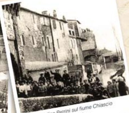
Molino Petrini sul fiume Chiascio 1822

“ La memoria delle proprie origini è garanzia dei nostri valori ispirati alla genuinità, all'orgoglio del proprio mestiere, al rispetto del consumatore. ”