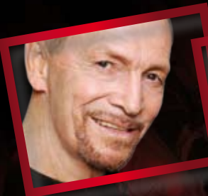
UMBERTO ORSINI LA LEGGENDA DEL GRANDE INQUISITORE DAL 23 AL 27 OTTOBRE