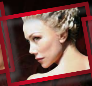
NANCY BRILLI LA LOCANDIERA DAL 4 ALL'8 DICEMBRE