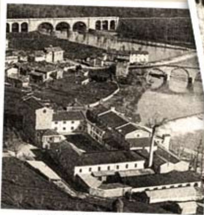
Molino Mignini sul fiume Tevere 1940