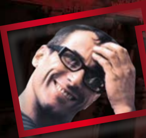
MAURO BIGONZETTI CERTE NOTTI 5 E 6 MARZO Umbria in Danza